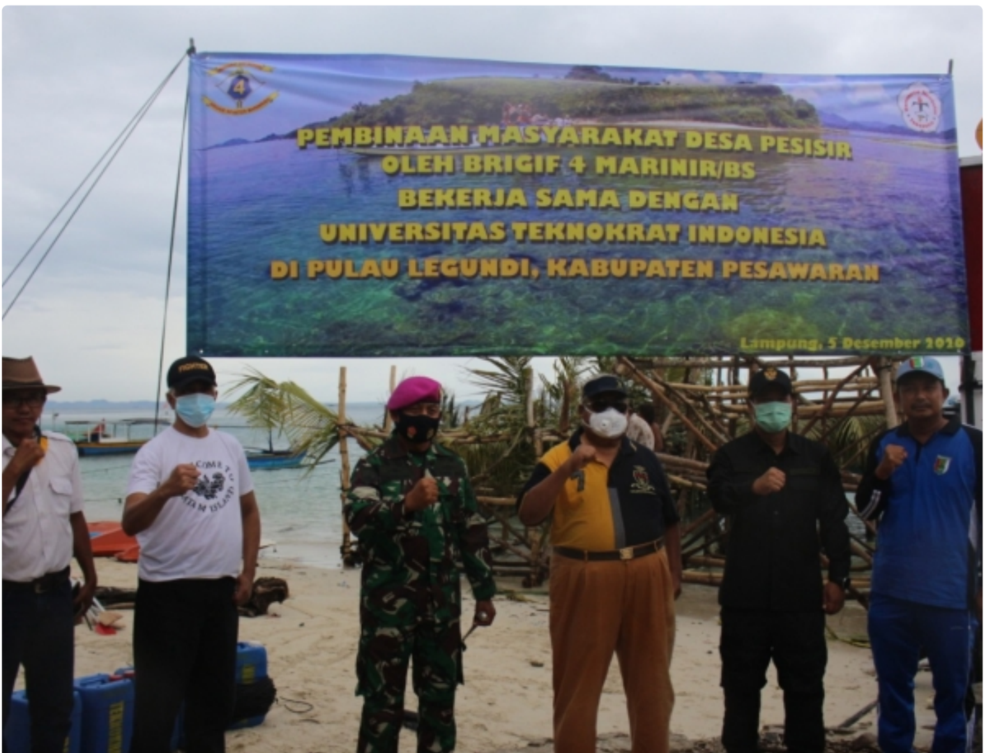
Brigade Infanteri 4 Mar/BS bersama Universitas Teknokrat Indonesia

PESAWARAN - Dalam rangka pembinaan desa pesisir (bindesir) Brigade Infanteri 4 Mar/BS bersama Universitas Teknokrat Indonesia memberikan bantuan berupa rumpon bagi masyarakat Pulau Legundi, Punduh Pidada,